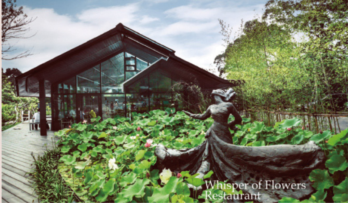
Whisper of Flowers Restaurant