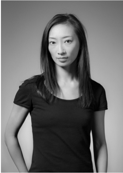
此頁起攝影 李佳暉